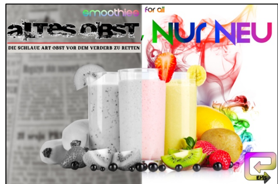
Abbildung 1: selbstgestaltetes Werbeplakat der EM5

Die Schülerinnen und Schüler der EM5 des Kuniberg Berufskollegs absolvieren eine Ausbildung zu Kaufleuten im Einzelhandel. Sie erleben tagtäglich die Lebensmittelverschwendung in ihren Ausbildungsbetrieben, z. B. in Discountern oder Supermärkten. Große Mengen Obst und Gemüse werden jeden Abend vernichtet. Äpfel mit Dellen, zu gerade Bananen oder zu kleine Mangos – die Gründe sind unterschiedlich, aber häufig nicht gerechtfertigt. So entstand eine Idee bei den Auszubildenden: „Lasst uns eine Aktion veranstalten, bei der wir dieses Obst und Gemüse vor dem Wegwerfen retten“. Der Stein kam ins Rollen und ein in vielerlei Hinsicht nachhaltiges Projekt entstand: Das Smoothie-Projekt!